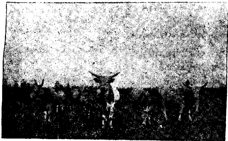
Țăurași Podolici din Comuna Mișca.