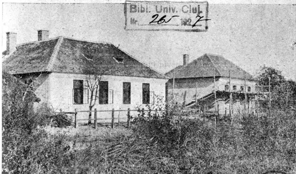
Noile construcții școlare din jud. Sălaj. Școala primară din comuna Bocșa-română.

ORGANUL OFICIAL AL REVIZORATULUI ȘCOLAR, AL COMITETULUI ȘCOLAR JUDEȚEAN ȘI AL ASOCIAȚIEI INVĂȚĂTORILOR DIN JUDEȚUL SĂLAJ