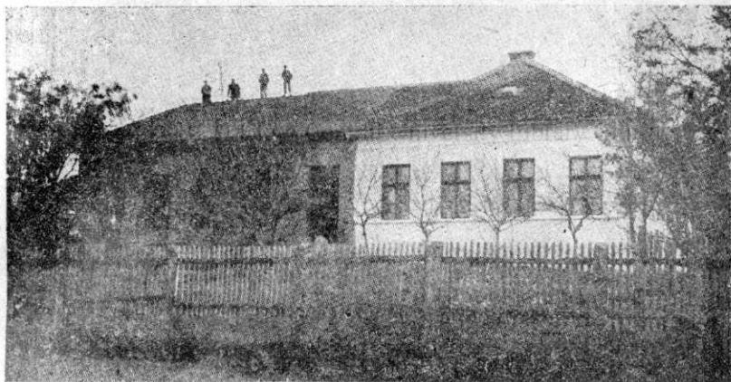
Școala primară de stat din comuna Zalnoc.

NOILE CONSTRUCȚII ȘCOLARE DIN JUD. SĂLAJ :