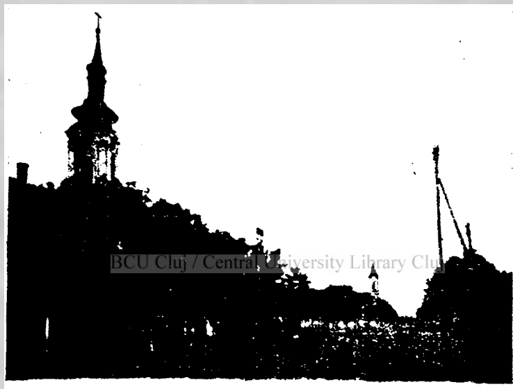
Vedere din strada principală. Biserica ortodoxă-română și cea romano-catolică.

Schimbarea calendarului n'a întâmpinat nicio împotrivire din partea nimănui. Și aceasta este o dovadă de maturitatea de gândire și simțire a românilor nerădenți.