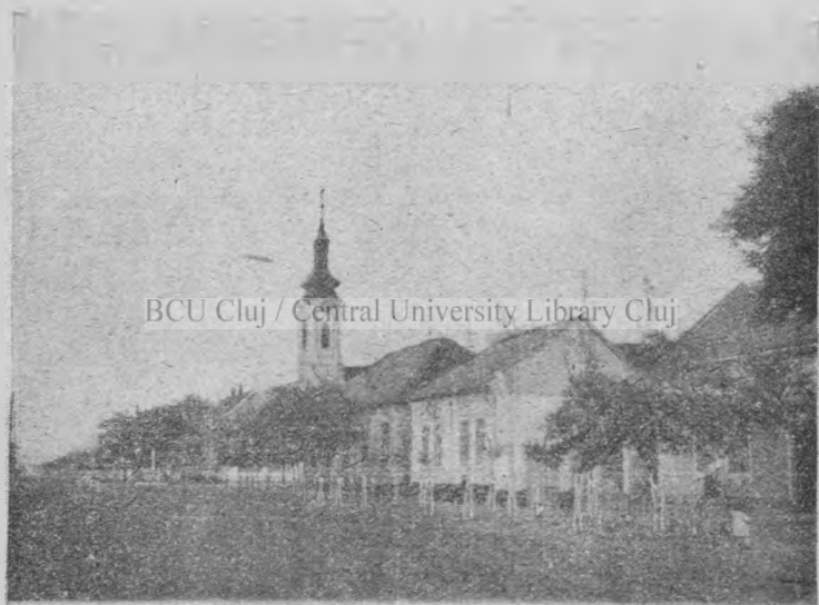
Vedere din strada principală.

Tuberculoza, care înainte făcea adevărate ravagii, în urma