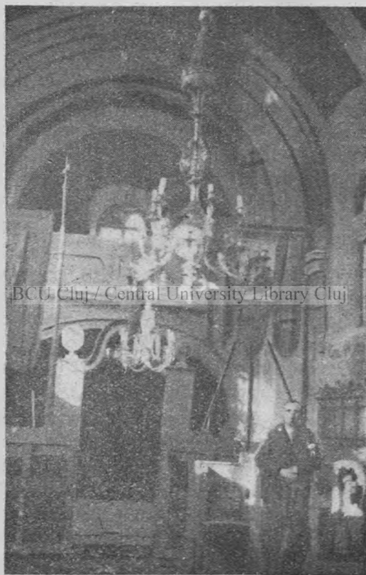
Fronaosul bisericii ortodoxe—române.

Mihaiu la 26 Octom. 1899, în valoare de 100 flor. — Naosul este luminat de 4 ferestri. De pronaos îl desparte 1 rând de scaune, cu un arc «outrepasse» la mijloc, ca la Comloș și Sânnicolaul-Mare. În fața scaunelor, de stânga, în naos, este strana epitropilor. Pe laturile dinspre pronaos ale arcului outrepasse suspendă icoana Mântuitorului și a Precurarei.