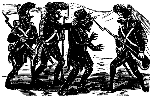
4. Amu prinsu pe unu comandante alu inamicului.