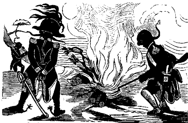
2. Ai nostri au sustienutu foculu.