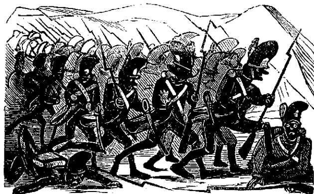
6. Ai nostri s'au retrasu incetu.

Proprietariu, redactoru respundiatoriu si editoru: Iosifu Vulcanu.