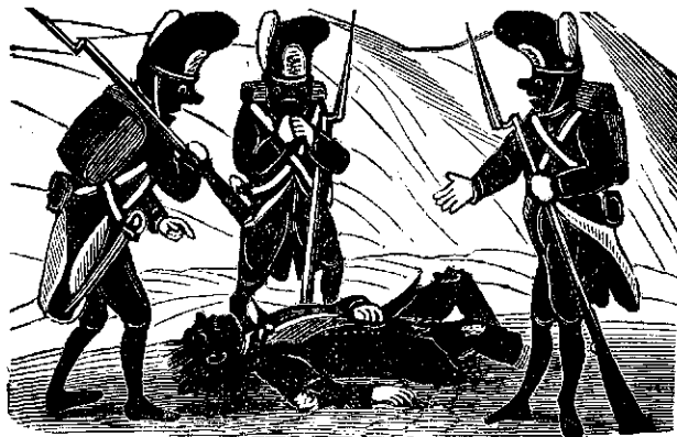
5. Dintre inimici au ramasu multi pe campulu bataliei.