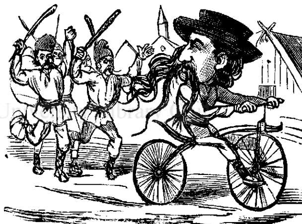
— Éta necuratulu! Haidati sê-lu batemu!