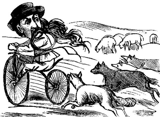
Abié iesî din orsiu la campu, canii de la oi toti se luara dupa elu.