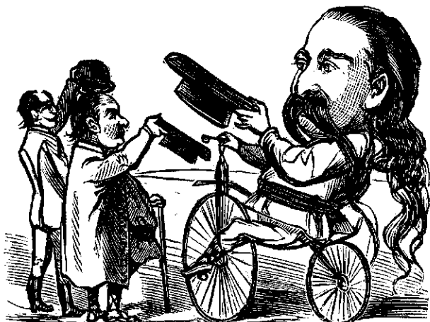
„Gur'a Satului“ plăca la Siomcut'a pe velocipedu.