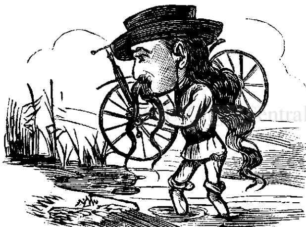
Ajungandu la o balta, fu silitu a luá velocipedulu in spate si a trece pedestru.