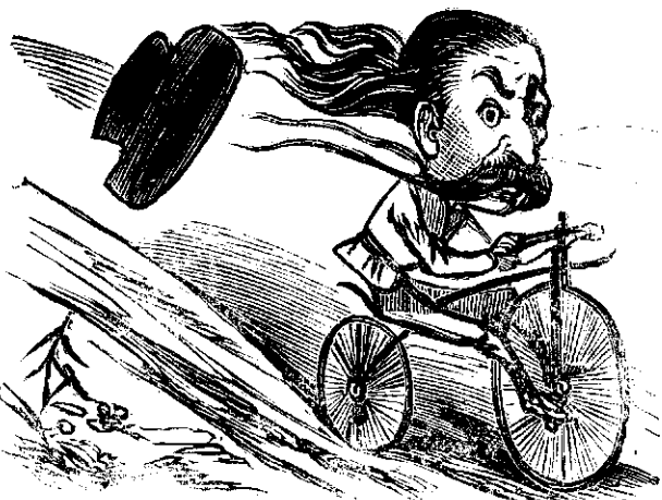
Primesdiós'a coborire de pe unu dealu.