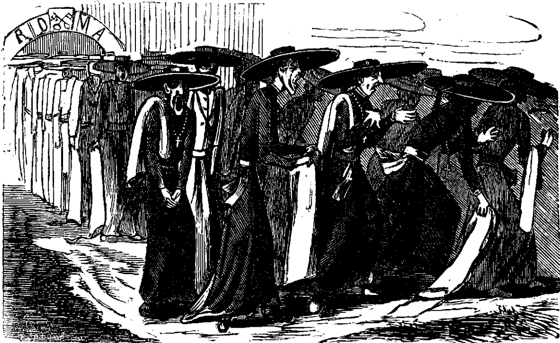
Si cum se voru rentorce de acolo !