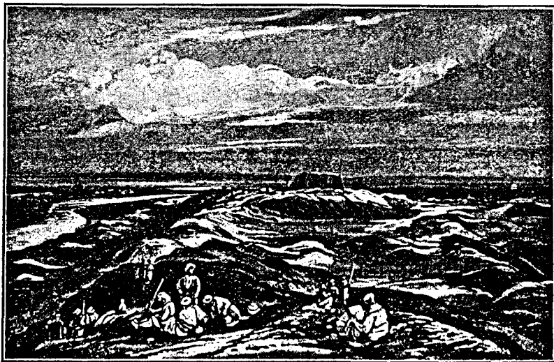
Babilonul în jărână.

Hai să intrăm pe uriașa poartă Iștar, cu toate că mai sunt o sută de