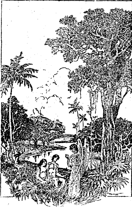
Fericirea primei perechi de oameni era asigurată prin ascultarea de Dumnezeu.

cea ce este bun. Și când Satana vine la noi cu înfățișarea de înger de lumină, așa cum veni și la Isus, să ne spună că necumpătarea e un păcat fără importanță, să nu uităm să-i spunem și lui și să ne împropătăm și noi în minte aceste fapte:-