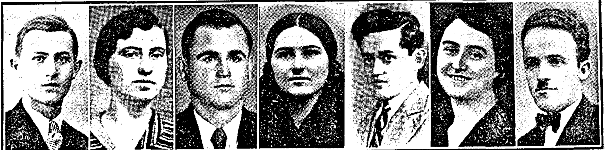
—(Gh. Ardreescu)— Ploesți