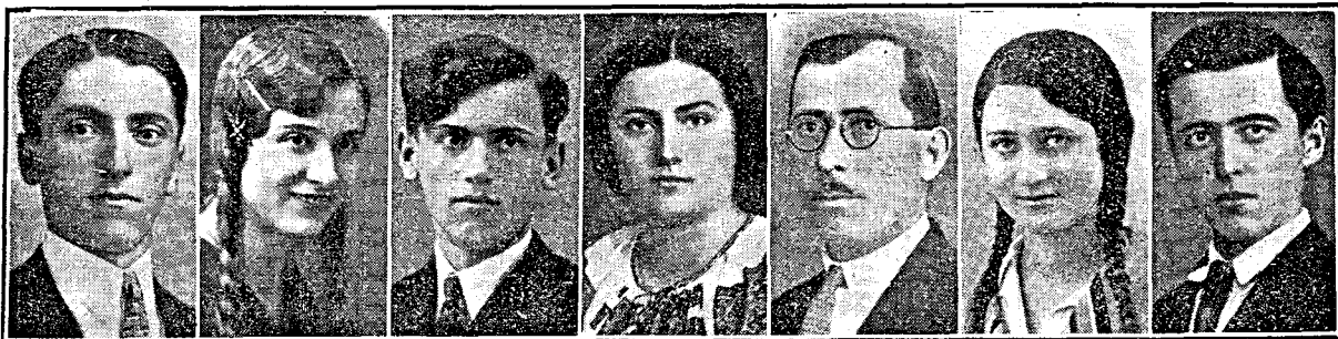
(Gh. Mocanu) Urleta, Prahova