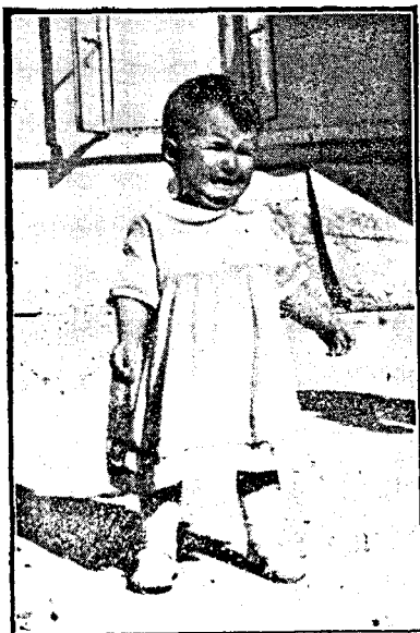
Pe mine de ce nu m'ați publicat?...