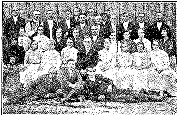
Grup din Com. Macea.

ADRIAN: — Am schimbat cuvântul intenționat.