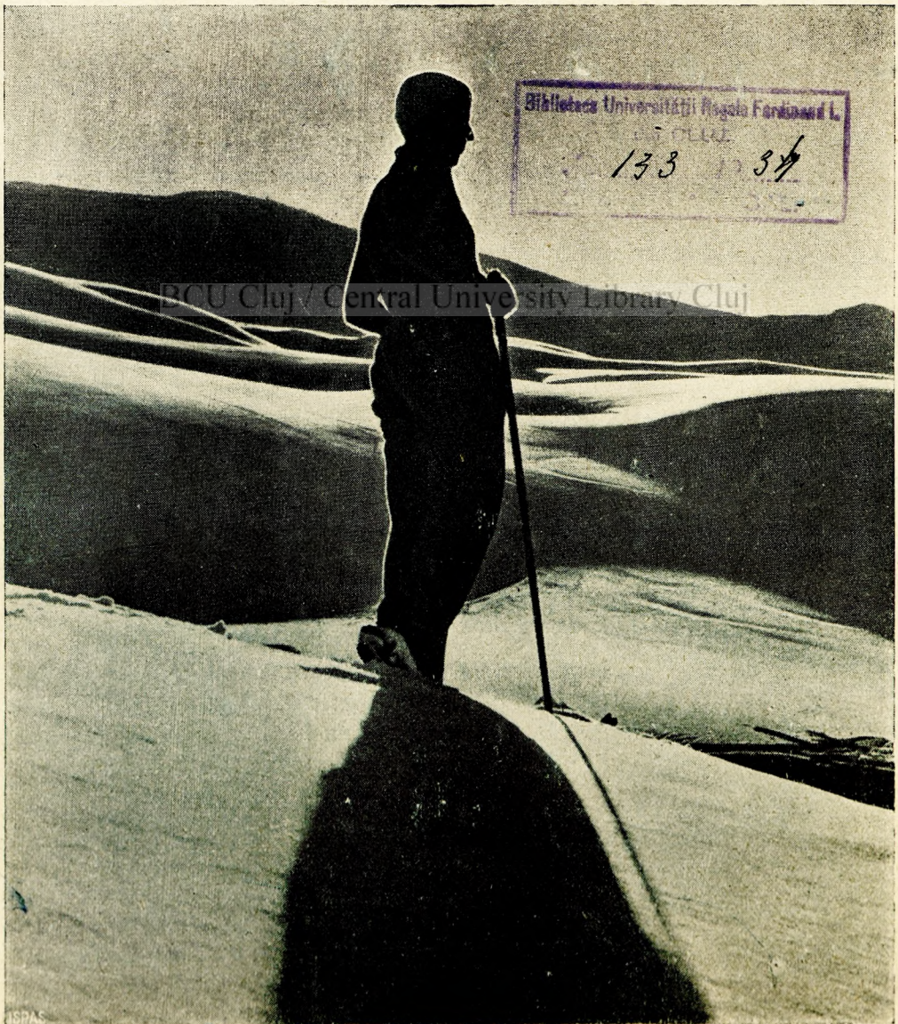
Fot. Meerkämper, Davos