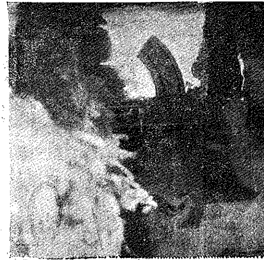
Un val de foc, se revarsă asupra mercenarilor

Deasemeni, au mai aruncat în aer două poduri de beton, de pe șoseaua Galico-Filadelfia și Lahana-Salonic, iar un alt pod între Paliohori-Amea.