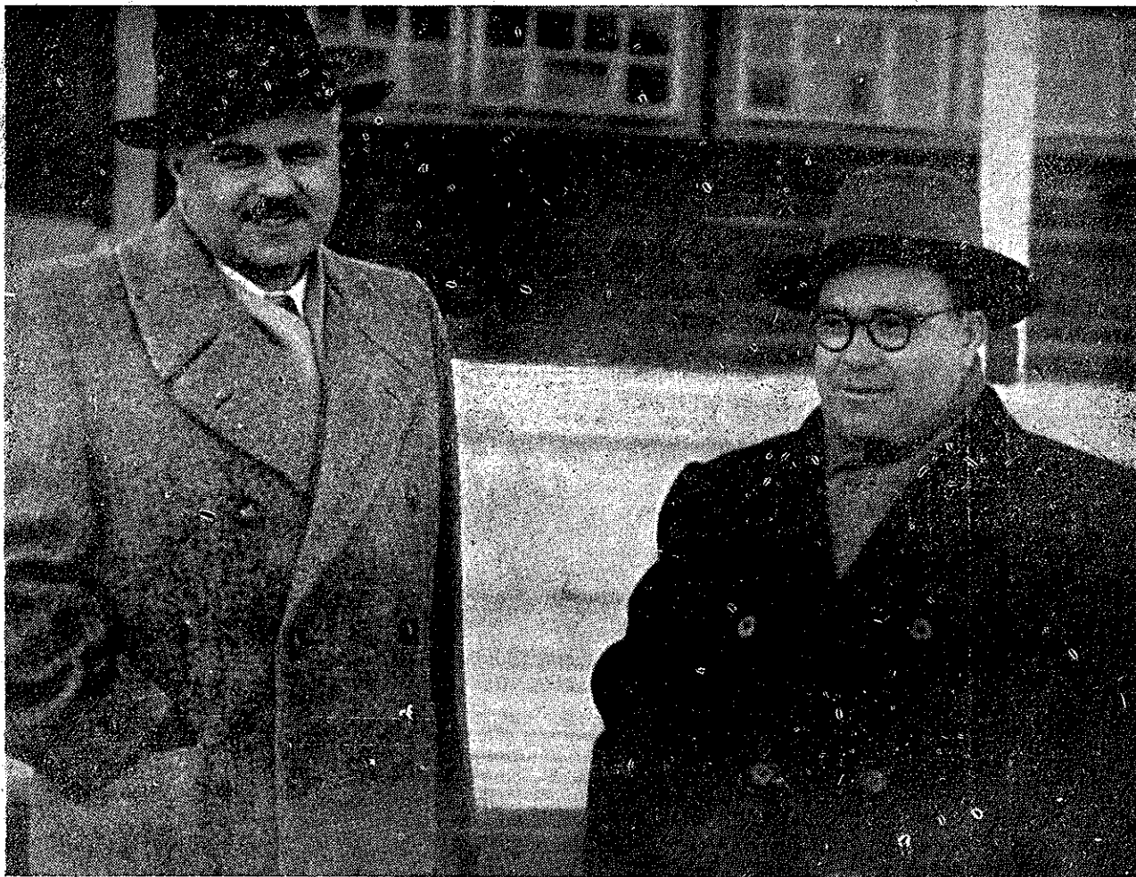
Dela stânga spre dreapta: MITSOS PARTSALIDIS, Președinte al Consiliului de Miniștri a Guvernului Democrat Provizoriu al Greciei — Secretar General al E. A. M.-ului. IANNIS IOANNIDIS, Vice-Președinte al Guvernului Democrat Provizoriu al Greciei.