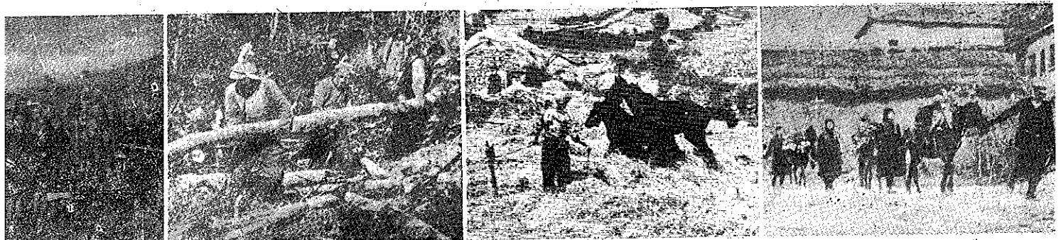
te satele țărani și țăranice pornesc în Regiunile libere și se înrolează în rândurile Armatei Democratice, ajută la lucrările de transportul de muniții și alimente cu catărul, etc.

OS ANTIPAS în insula iu, a studiat ersitatea din și a activat esalia. A fost tea luptelor li din Câmpia iei, pentru pă- A fost asasi- Pyrgheto în bătăușii mo-