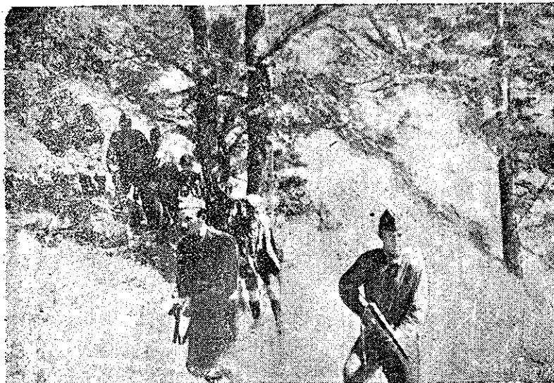
Luptă oștii Armatei Democratice prin lupte aprige dobândesc zilnic noul victoriei