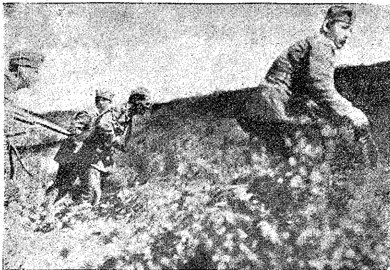
Luptătorii dintr'un grup de partizani, înaintează

În acest timp, unitățile noastre trec la contra atac și urmăresc până la rău ultimele rămășițe inamice.