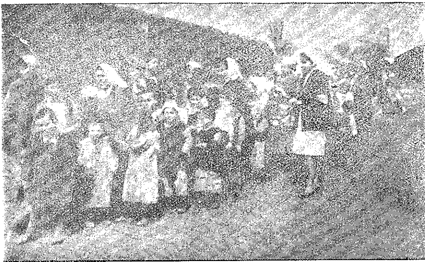
Copii greci în timpul sosirii lor în Ungaria

le sufereau părinții copiilor și pe cari aceștia le vedeau cu proprii lor ochi, înnebuneau în afară de aceasta, masacrele pe cari le făceau teroriștii au înrăutățit și mai mult situația lor. Într-un număr precedent al Buletinului nostru, am descris masacrul celor 40 de copii în satul Stromni (Ghionna). Cităm mai jos și alte câteva cazuri.