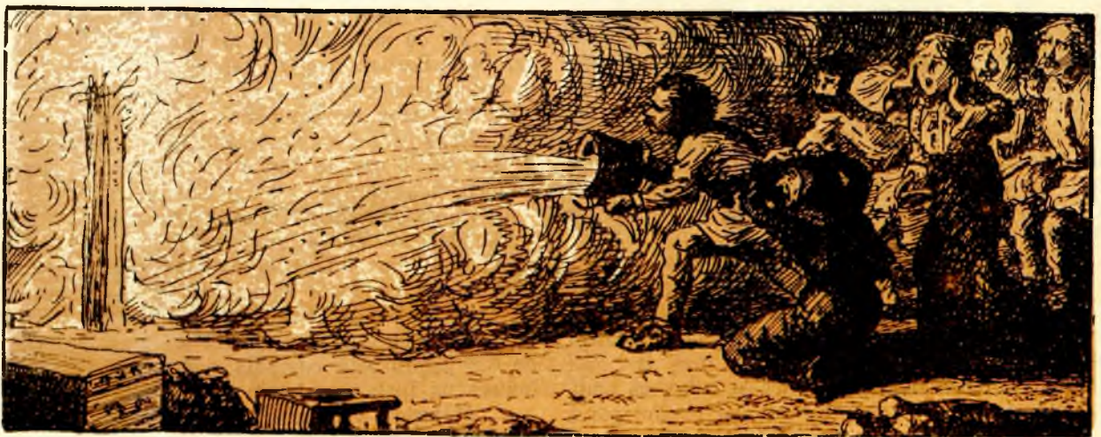
Și până sar oamenii casa se făcuse serm.

— Acesta nu-i vr'un lucru pân'pe-acolo, copilă hăi, zise baba. Ia, du-'e în casă, trezește-ți copilul din somn și el atunci are să înceapă a plânge; pe urmă pișcă-l tot câte-oleacă și el are să înceapă