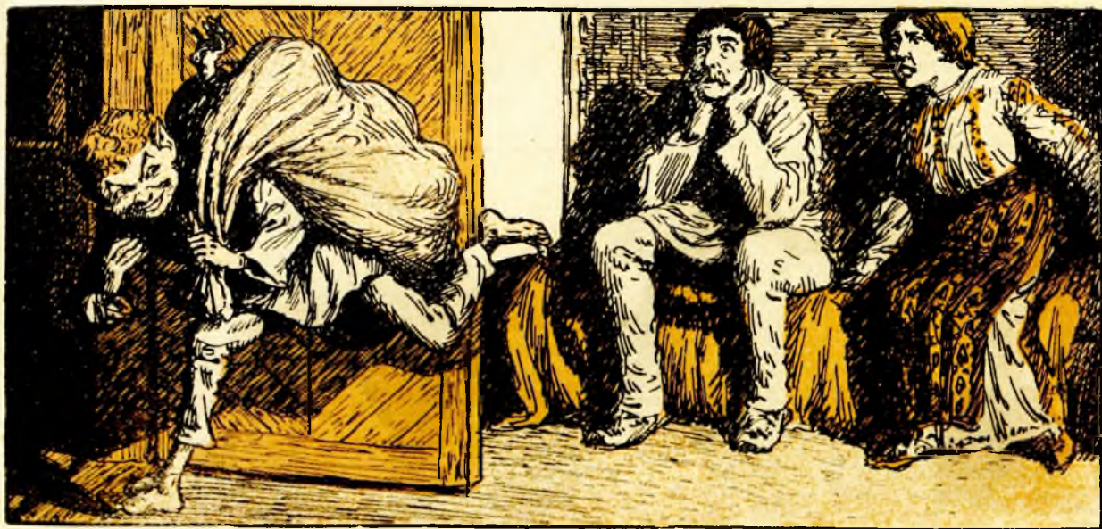
Chirică înșfacă sacul cu babă cu tot și se face nevăzut...