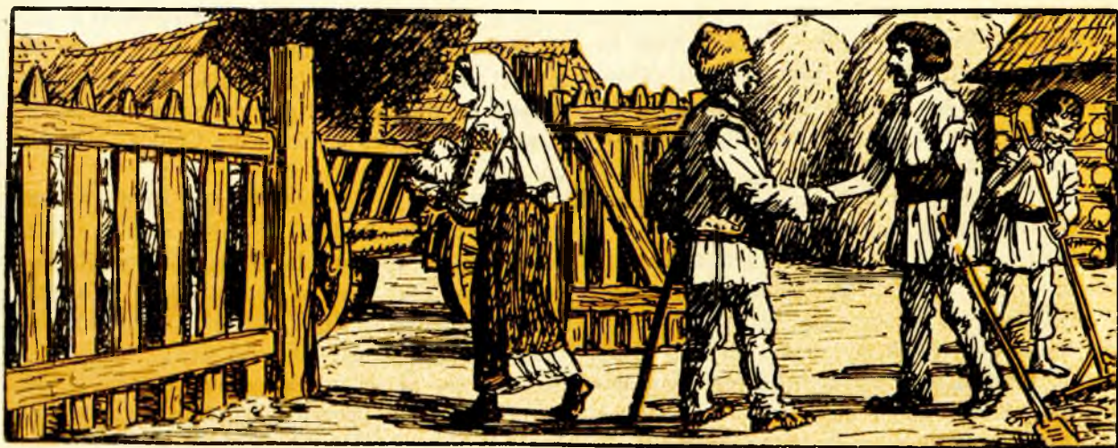
Socrusău atunci ia nevasta lui Ipate cu copil eu tot și se duce.

Atunci, bucuria lui Ipate! Incepe a se ține de fată ca scaiul de oaie. Și unde nu ți-o înșfacă pe sus și se ieu ei ba din tâlcuri, ba din cimilituri, ba din păcălit, ba din una, ba din alta și de co-