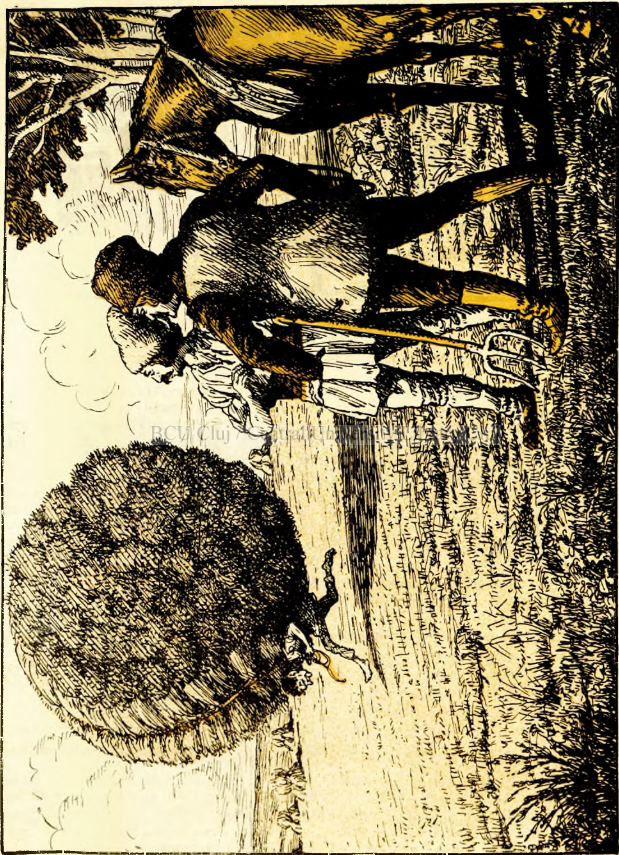
Iară boerul a încereunit uitându-se la dânsul cum se ducea.