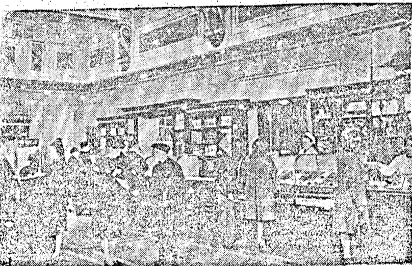
Az áruszállítás után nagymértékben emelkedett a szovjet dolgozók vásárlóképesége. A sztálini élelmiszerüzletekben a dolgozók nagy választékból vásárolják meg a kívánt minőségű élelmiszereket.