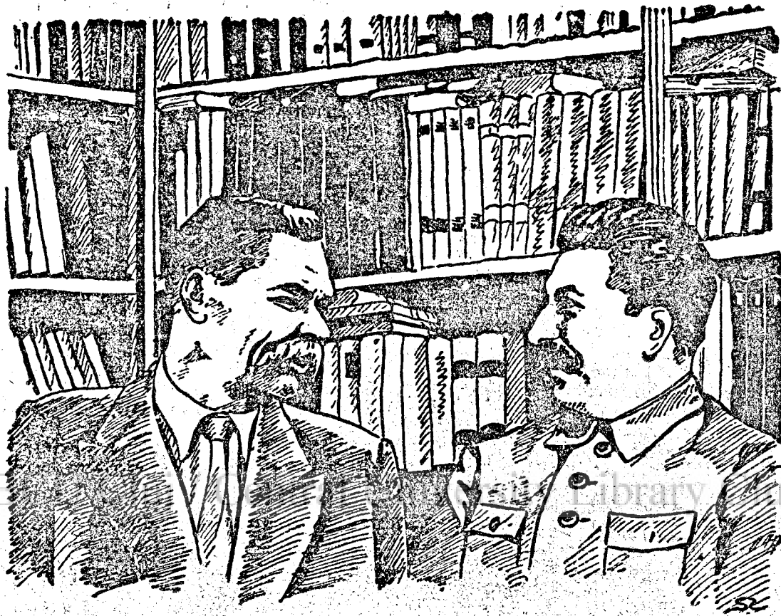
SZTALIN ELVTARS GORKIJ MAXIMMAL, A NAGY SZOVJET IRÓVAL

— Gyertek azzal a támadás- sal Sztálin elvtárs — válaszol- ták a munkások.