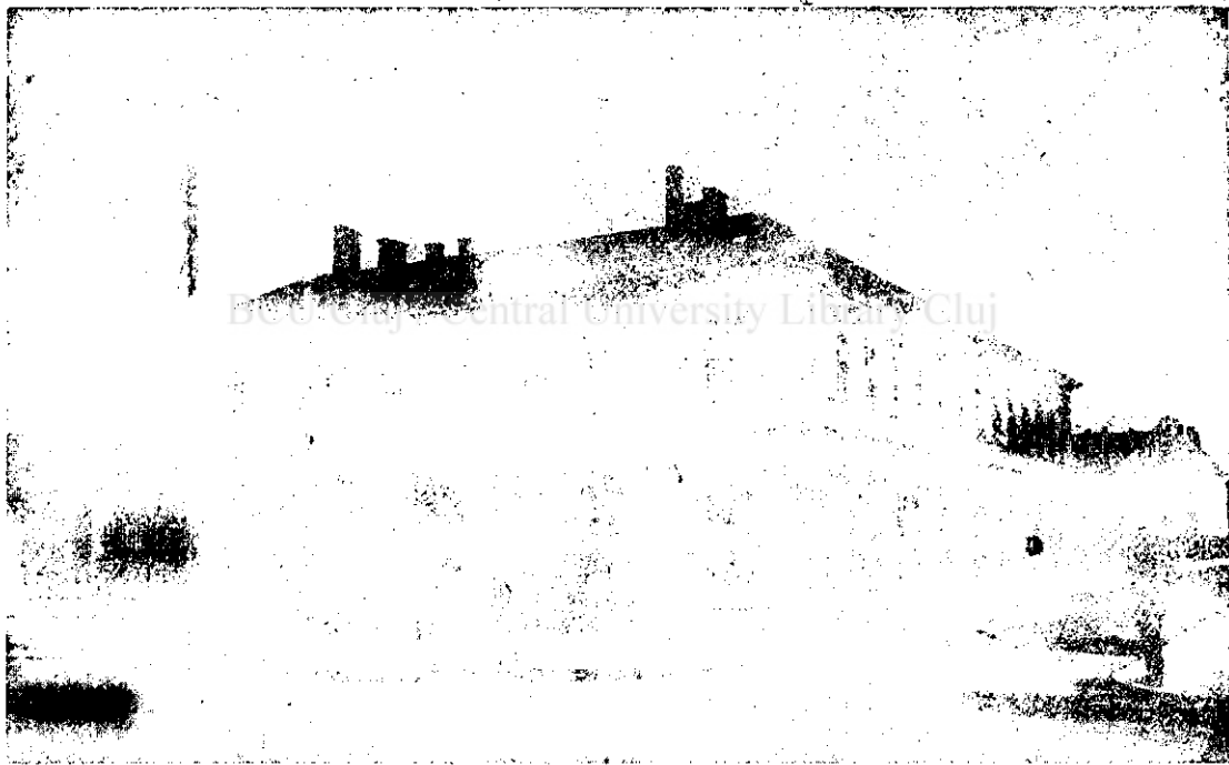
Institutul de surdomuți din Cluj.

S'au luat dispoziții, ca în școala de repetiție generală să se facă lecții de istorie națională și de literatură prin citirea autorilor potriviți în acest scop. Separarea școlii de repetiție — după sexe — este ținta ideală, pe care o urmărim ca și D-Voastră și stăruința noastră merge în această direcție. E regretabil însă, că cu corpul didactic scăzut, nu putem face față momentan acestei cerințe atât de importante.