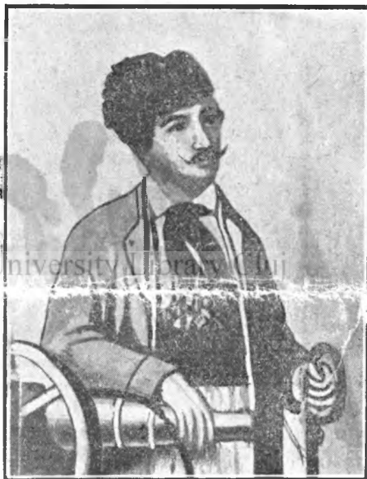
Avram Iancu, regele munților

Nicăiri n'a bătut inima românească pentru trezire mai cu putere ca în Ardeal, la anul revoluției, pe câmpia Blajului, unde cinci-zeci de mii de români au alergat din toate părțile, înfruntând toate piedicele și toate amenințările, ca să jure toți ca unul: « Murim mai bine 'n luptă cu glorie deplină, de cât să fim robi iarăși în vechiul nos' pământ! »