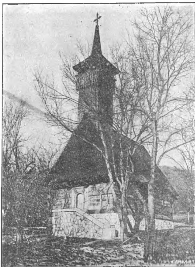
Vechea Biserică din Albac, unde Horia a jurat răzbunare contra ungarilor

Dar între tâmplesle'i albite Purta un sfânt vis de mărire, Ce da ochilor lui slăbiți Acea profetă privire: Speranța celor asupriți.