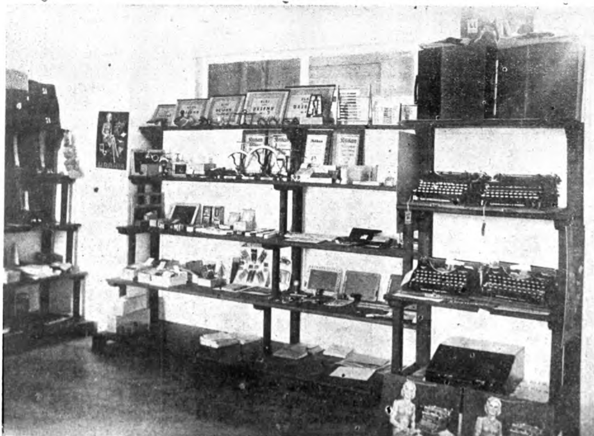
Expoziția de rechizite și articole de birou care se pot procura dela Federația Națională de Librărie, Editură și Arte Grafice din București, Calea Calărăși No. 67-69.