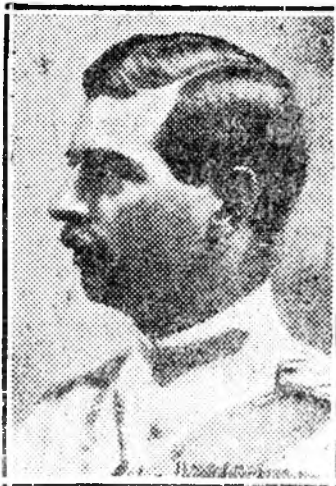
M. S. REGELE

Trăiască Majestatea Sa Regele! Trăiască Augusta Sa Dinastie!