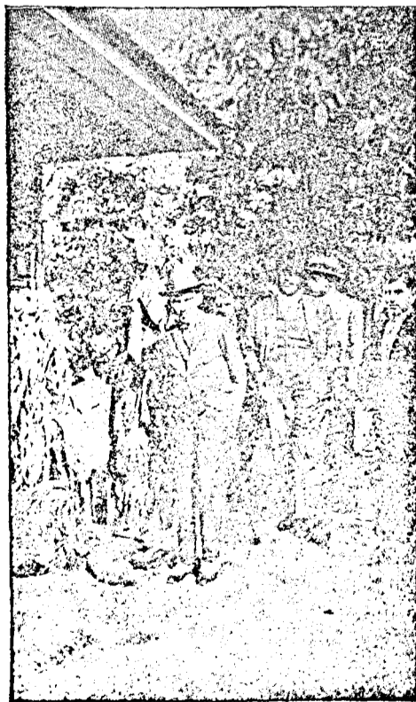
Kép a kolozsvári mezőgazdasági kiállításról.

A bécsi városi mérnöki hivatal körültekintő és elővigyázatos becslése szerint az első irtáskor kb. 250,000, a másodiknál pedig 500,000 patkány lett megmérgezőve, vagyis a két napon együtt legalább \frac{3}{4} millió patkány lett kipusztítva. Ezt az akciót Bécs város vezetősége ezentúl minden 1-2 évben meg akarja ismételni.