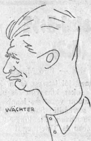
Deheleanu a csapat tudósa, állandóan tanul (nem futballozni).