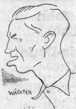
Kotormány a fakir, zsonglőr