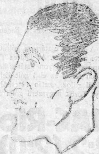
Glasz a skót csatár, a gólokkal nem fukarkodik