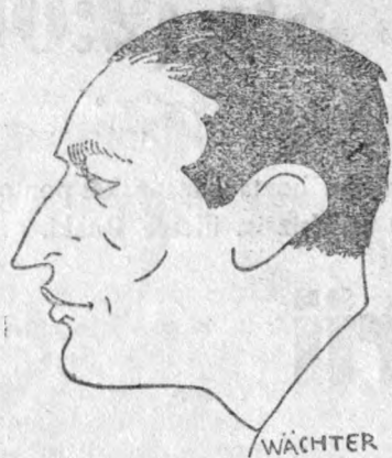
Dobay Pista a leggólképesebb csatár, nélküle esem tudjuk képzelni a válogatottat