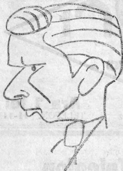
Bindea fiatal csupa temperamentum, nem ijed meg senkitől!