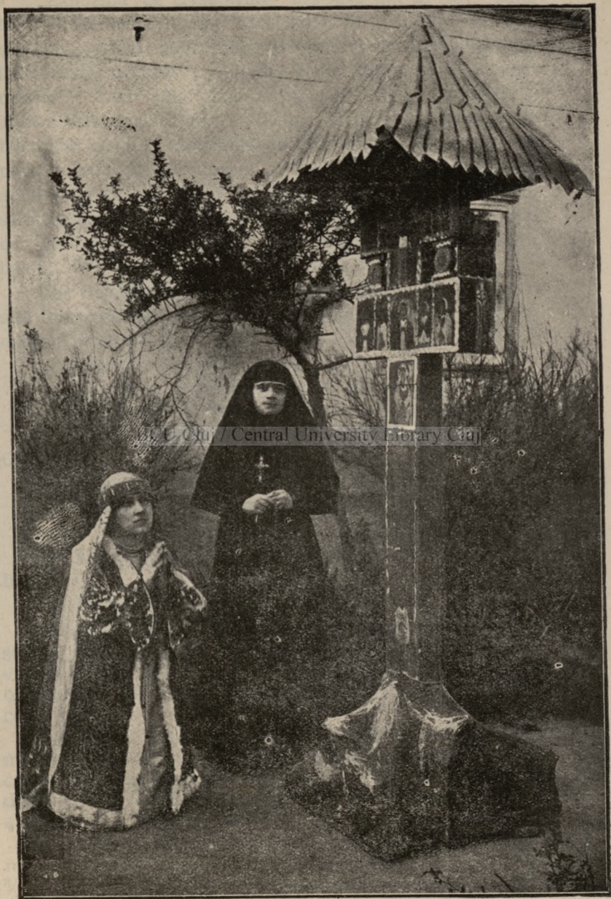
CRÎȘANA, MAICA FEVRONIA.