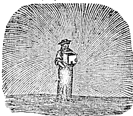
Szórva vető kézi vetőgép.

nagyon gyors, tiszta és könnyű. A morzsoló vasból szolidan van készítve, egy-egynek ára 2 frt.