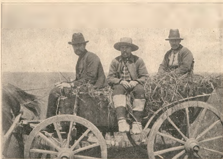
Bulgari mergând la târg.

Slavă ție, armată a României! Slăvită fie ziua care ne-a dovedit că mai presus de filozofia brutală a stomacului stă filozofia iubirii de cele ideale. Slavă ție, popor român, plin la suflet, mimos și gata de jertfă. Din nou, ca puhoiul apelor, ai pornit spre Dunăre, ridicându-te cu toată sila ta asupra vecinului fără credință și fără omenie, care îți plătise