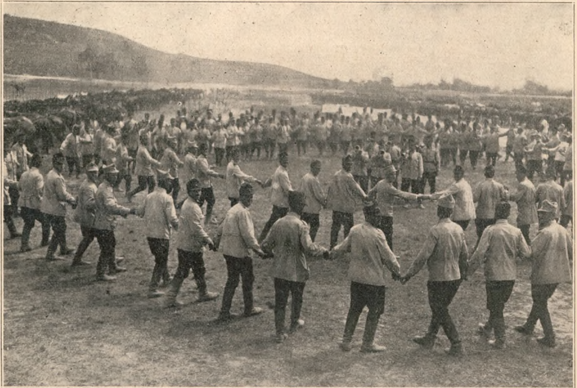
Hora dela Ecrene (după încheierea păcii).

Ca pe foc a stat Conu Alecu în biserică.