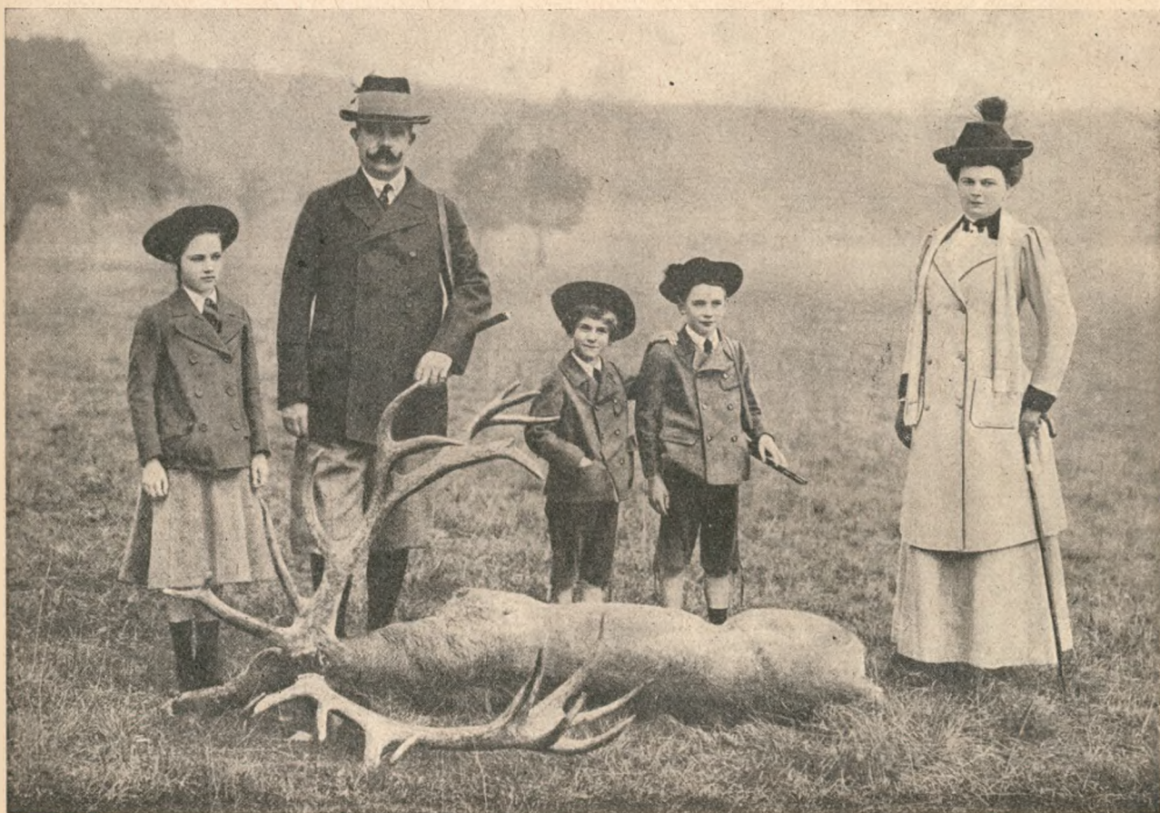
Arhiducele Francisc Ferdinand, soția și copiii săi.

deșteptase cereau, toate, o strălucire neobișnuită, un fast extraordinar, care să fie la înălțimea marelui rol ce-l așteptă în viitor — a fost înmormântat cu o grabă și lipsă de asistență care a provocat o manifestare ostilă chiar și din partea aristocrației celei mai aulice și dinastice.