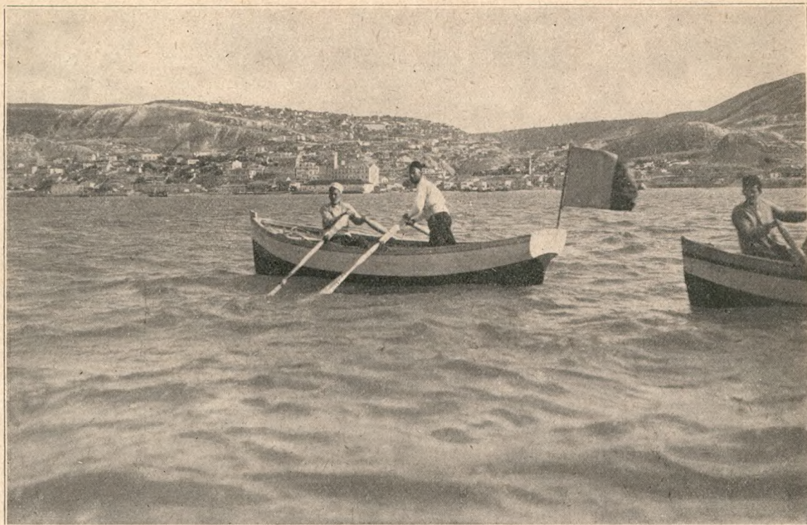
Marea la Balcic.

Deliormanului, ca răsplată pentru jertfele noastre, nici ceace ne ofereau din nou împrejurările din 1886.