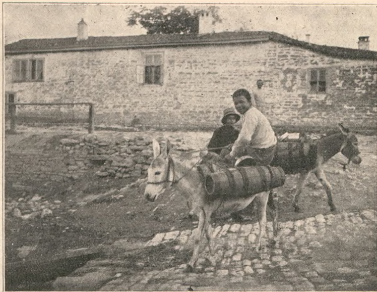
Transport de apă.

Aduceți-vă aminte că, în deosebire de alții