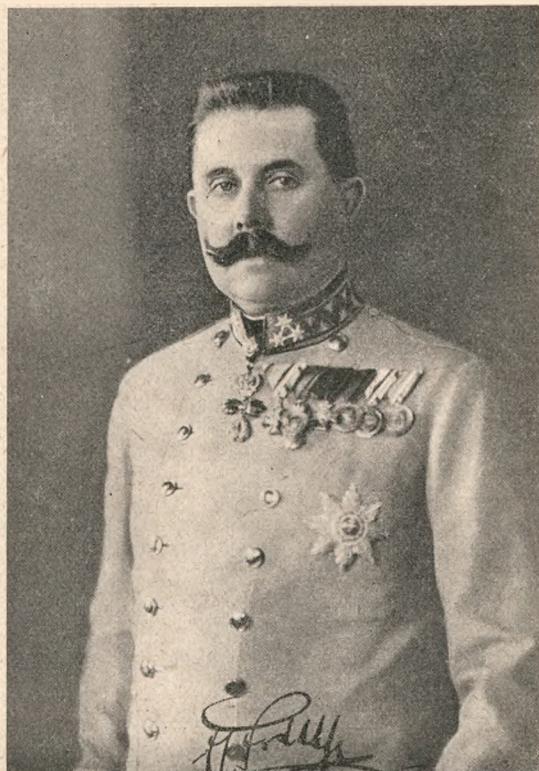
Arhiducele Francisc Ferdinand.

un articol mai lung, punând în frunte titlul „The Austrian Sfinx“ (Sfinxul austriac), — un om care știe ce vrea, despre care însă nimeni nu știe ce va face.