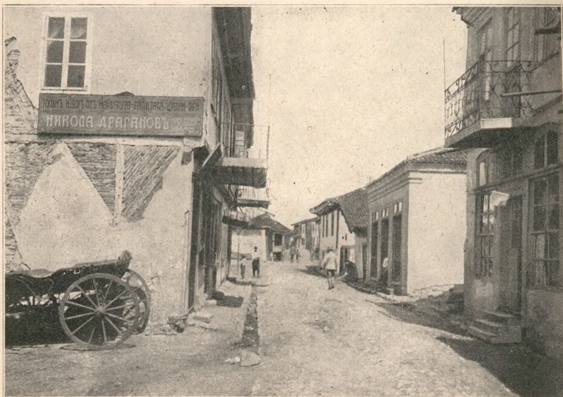
O stradă în Turtucaia.

coveanu, Sublima Poartă devenise pentru noi o spaimă a spaimelor, așa că ajunsesem a privi întocmai ca niște paralitici la toți vecinii cari se îmbiau cu suveranitate asupra noastră, rupând din pământul nostru ca dintr'un loc viran. Oltenia furată câteva zeci de ani. Bucovina pierdută; Basarabia pierdută. Vorba evangheliei: împărțit-au vest-