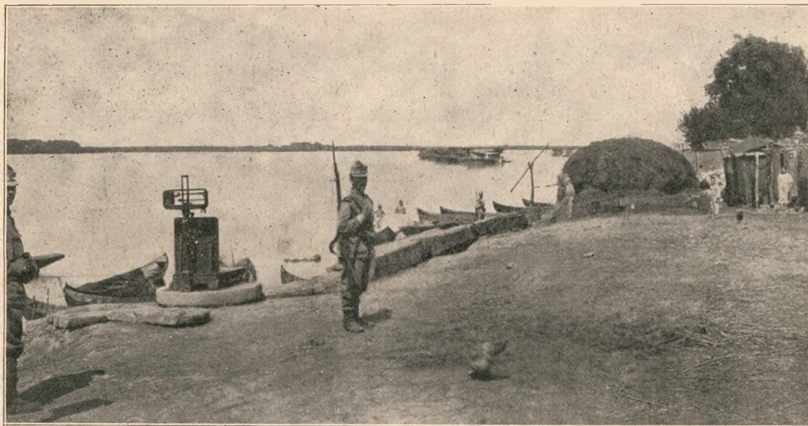
Debarcaderul pescarilor (Turtucaia).

când și Apusul se uită spre Răsărit; când voevodul dela Suceava eră slăvit de toți ca „atletul întregii creștinătăți“, iar Moldova și Muntenia erau mari puteri militare, ridicând