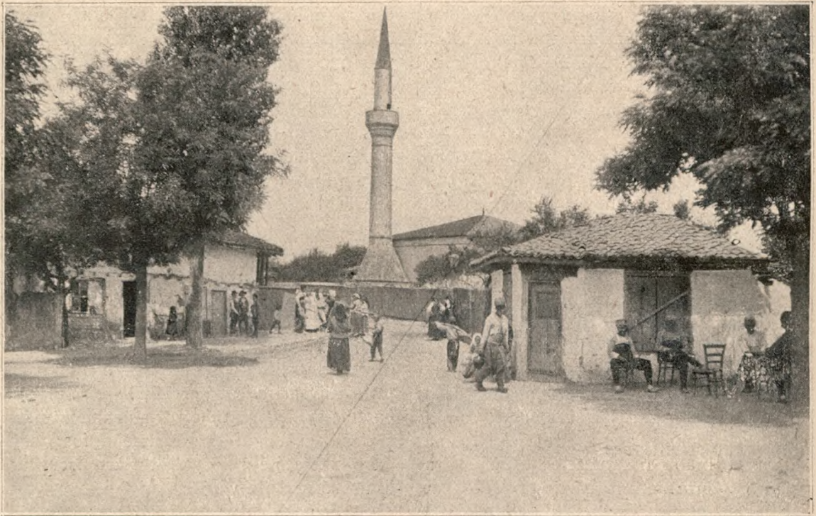
O mahala turcească în Silistra.

oameni de arme ne-am ținut în picioare împotriva celui din urmă val mongolic — al Turcilor. Istoria e de față: în cele dintâi ciocniri cu Turcii, cât erau ei de groaznici, noi am rămas biruitori. Vladislav biruitor pe malul drept al Dunării; Mircea biruitor pe malul stâng, la Rovine. Corvin, biruitor în Banat; Ștefan biruitor la mare. Și chiar când cumpăna a început să se plece, când toți