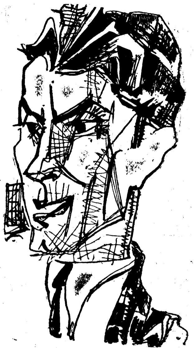
de Marcel Iancu