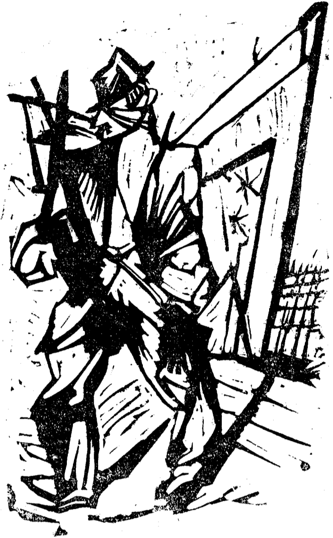
Xilografie de Marcel Iancu