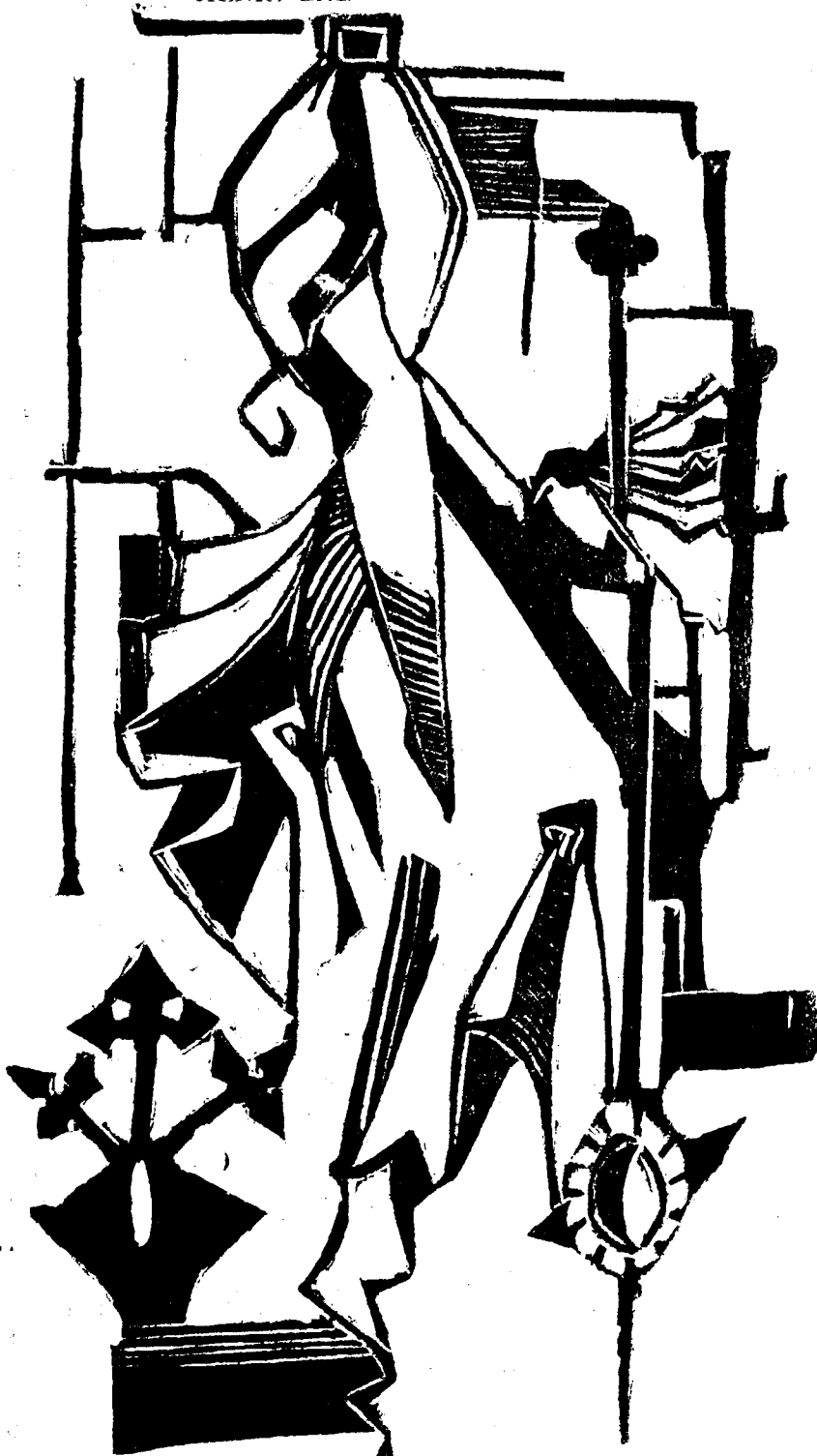
Construcție de Marcel Iancu