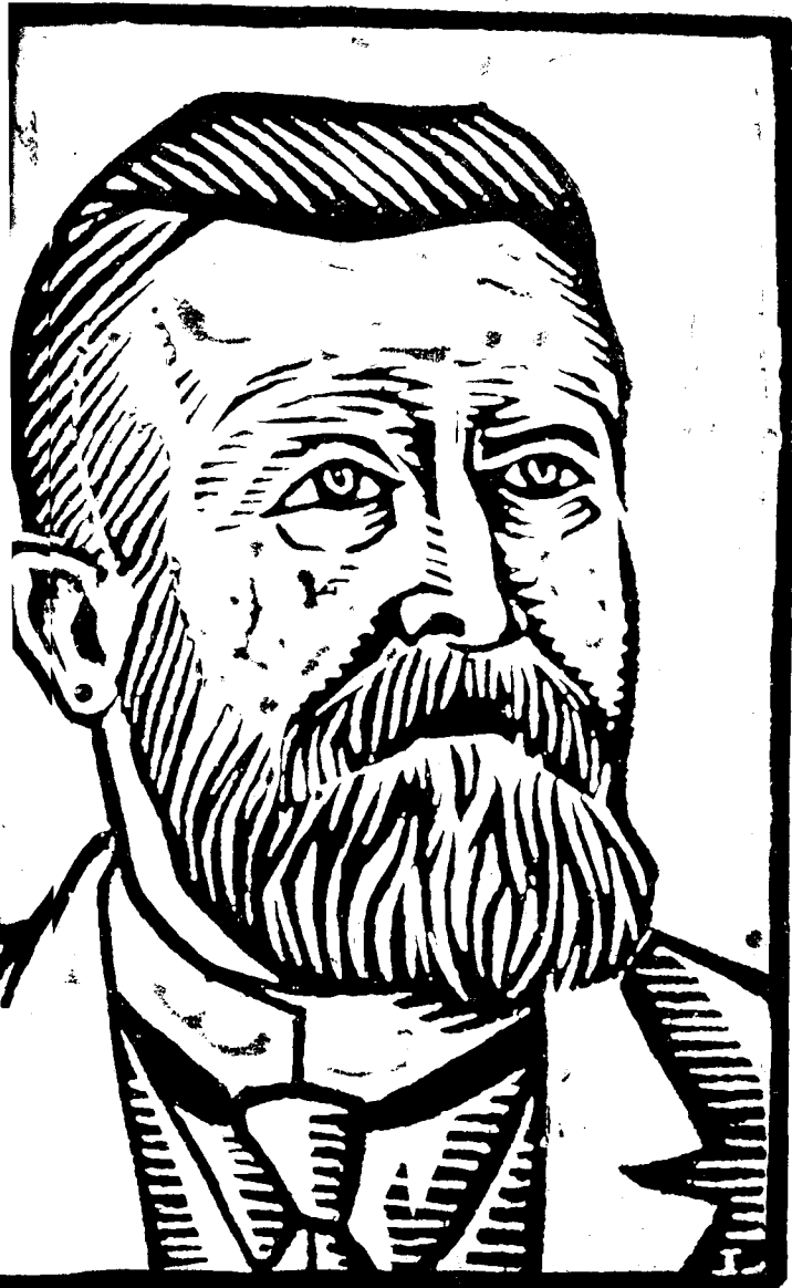
Xilografie de Lebedef