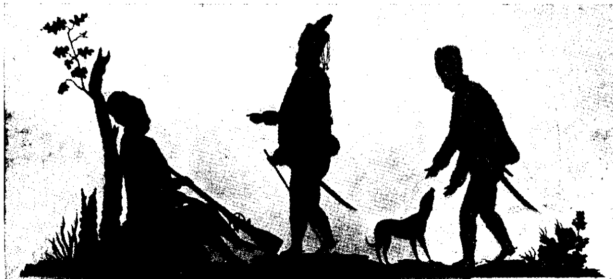
HORIA, CLOȘCA ȘI CRIȘAN CU CÂINELE SĂU Siluete contemporane de un artist din Viena

În pacea de veci, mormintele Urme și oase străbune — Și durerea noastră doinată De-ale vântului, năvalnice strune.