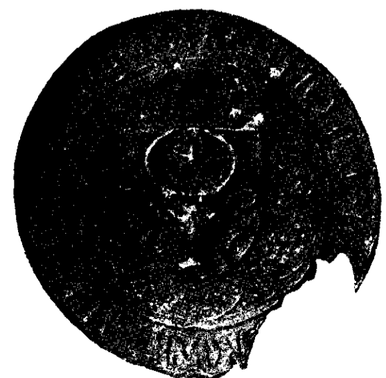
PECETIE DELA ALEXANDRU CEL BUN

Nouăzeci și trei de ani se împlinesc de atunci. Poate că în noaptea asta, după ce cuvintele comemorative vor fi rostite în largul țării, acolo, în Câmpul Libertății, pe locul unde atunci se înălța tribuna, se va scula din morământ umbra lui Bărnuțiu, și va privi înmugurată în cele patru zări ale Transilvaniei.