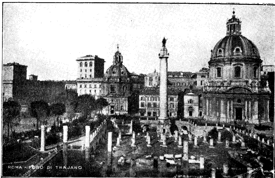
FORUL LUI TRAIAN. ÎN MIJLOC COLUMNA.

În 1938 Papa Pius XI de sfântă pomenire a dispus să se execute în facsimil (180 bucăți) basoreliefurile Columnei lui Traian ce se află în Forul cu acelaș nume pe care sunt sculptate în relief războaiele purtate de Traian împotriva Dacilor și să fie așezate în muzeele Vaticane. Inscricția de pe soclul reprodus constituie pentru noi un adevărat monument național. Pe soclul columnei sunt scrise următoarele cuvinte :