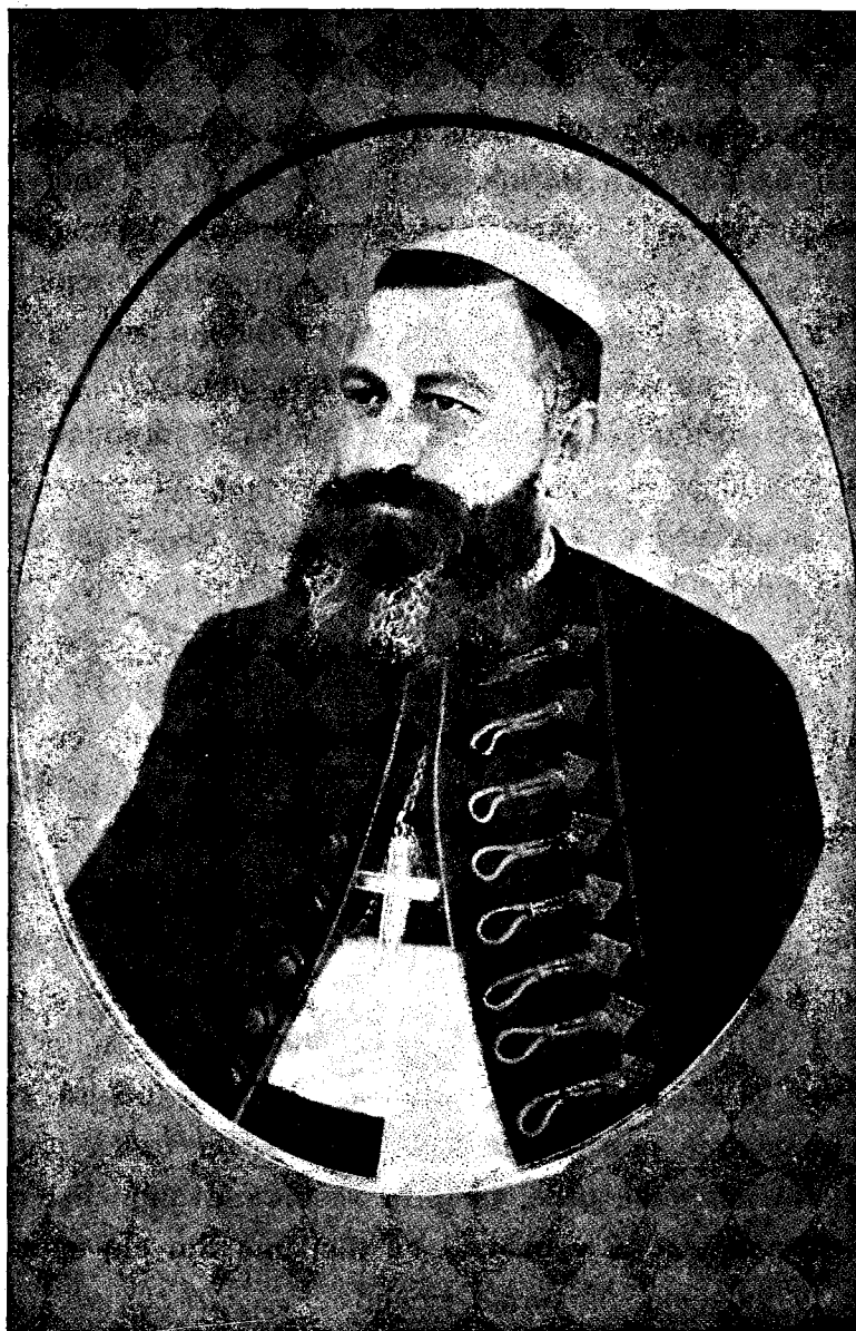
INALT-PREASFINTIA SA DR VALERIU TRAIAN FRENȚIU, EPISCOPUL ORĂZII.

Abonament: Pe un an..... 200 Lei. Exemplarul ..... 5 Lei.