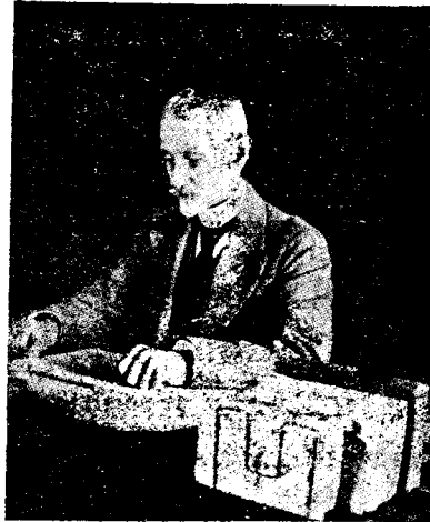
Di G-ral Averescu la masa de lucru.

Ca militar a cutreerat Occidentul Europei, aducând cu sine din Apus o destoinicie militară excepțională în latura cărătură-rească a tacticii și strategiei.