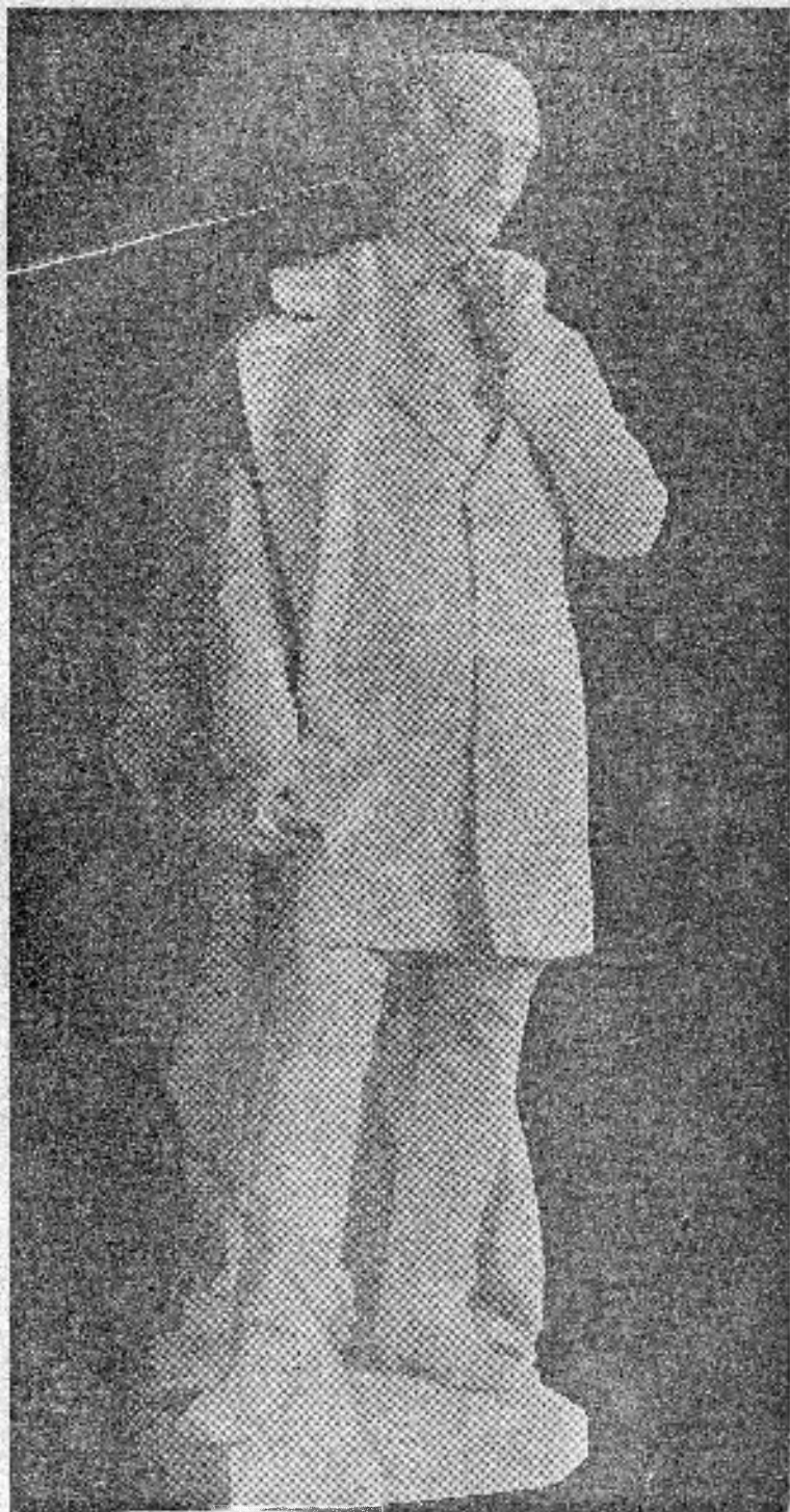
Statua lui Vasile Alexandri din Iași.