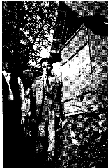
2. Feljegyzéses kaptárajtók, balról a gazda.

egy kas méhet, az el is pusztult. 1923-ban egy utórajt szerzett. 1924-ben lett 3 raja. A következő évben készítette az első kaptárt.