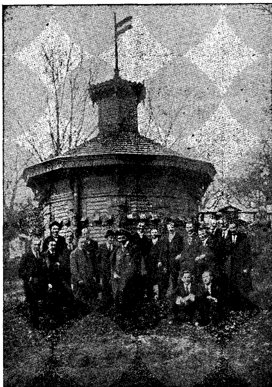
Az Erdélyrészi Méhészegyesület méhtelepe.

Megjelenik rendszeres viszonyok között havonta legalább 1 ivnyi terjedelemben.