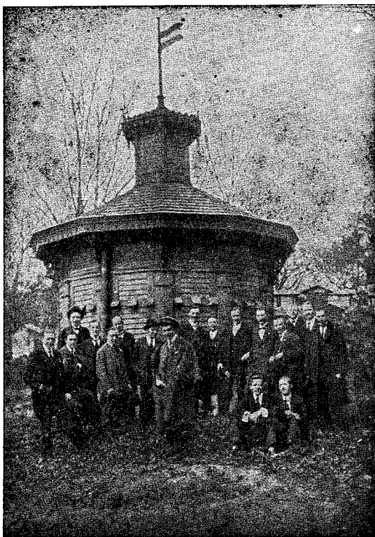
Az Erdélyrészi Méhészegyesület méhtelepe.

Megjelenik rendes viszonyok között havonta legalább 1 ívnyi terjedelemben.