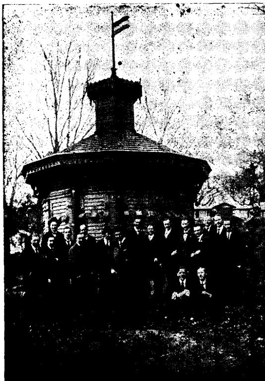
Az Erdélyrészi Méhészegyesület méhtelepe.

MEGJELENIK RENDES VISZÓ- NYOK KÖZÖTT HAYONTA.