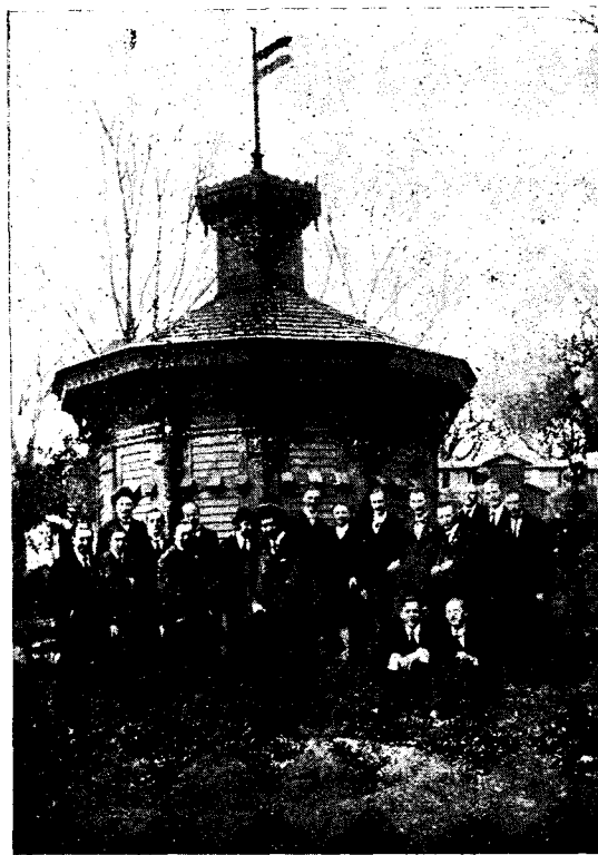
Az Erdélyrészi Méhészegyesület méhtelepe.

MEGJELENIK RENDES VISZO- NYOK KÖZÖTT HAVONTA.