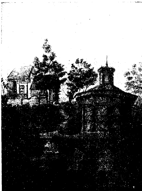
Az Erdélyrészi Méhész-Egyesület méhtelege.

Kolozsvár 1916. Márc.—Április XXXI. évfolyam 3—4. szám.