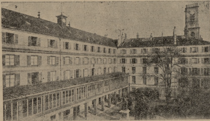
Institutul național de surdomuți, Rue Saint Jacques Paris.