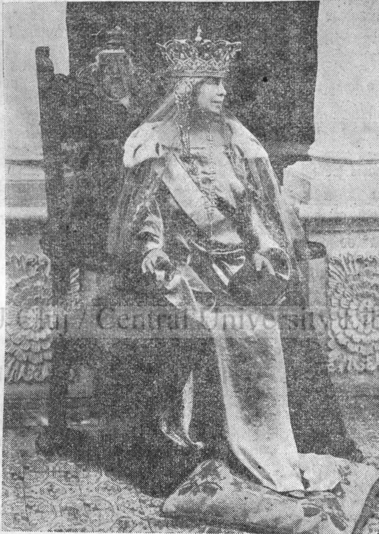
REGINA MARIA ȘEZÂND PE TRON

Aceasta ți-o pot spune astăzi, căci nu mai sunt în viață. În acele zile mi-ai dat un nume ce mi-a fost drag: m'ai numit »Mama tuturor» și așa vreau să rămân în amintirea ta, aceia care putea totdeauna să fie găsită în clipele de durere sau de primejdie.