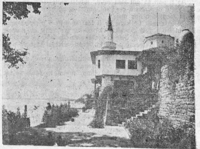
Castelul dela Balci, în care a fost îngropată inima Reginei Maria.