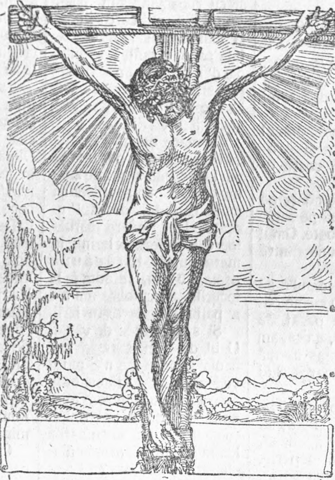
Mântuitorul nostru pe cruce

Ostașii au adus pe Isus în curte și au adunat toată ceata ostașilor. L'au îmbrăcat într-o haină de purpură, au împletit