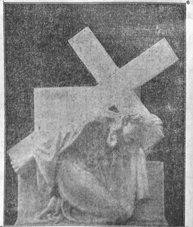
Sub povara crucii