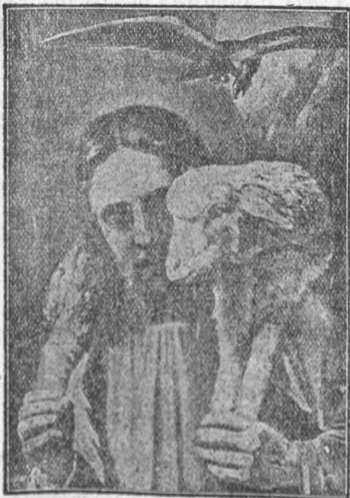
Isus cu mielul

Dea Dumnezeu ca și în țara noastră dragă să învie binele și fericirea spre slava lui Dumnezeu.