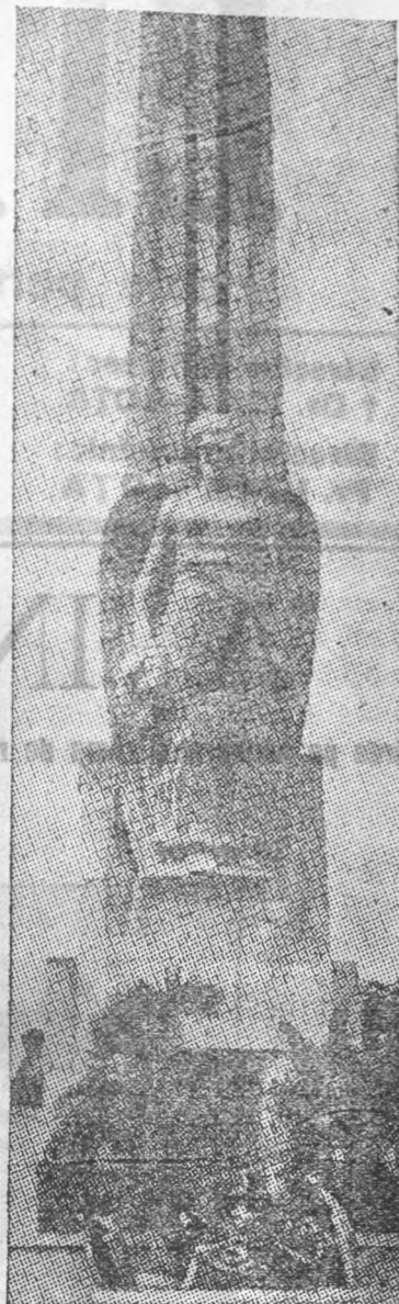
MONUMENTUL LUI HORIA-CLOȘCA-CRIȘAN LA ALBA-IULIA. Este un stâlp puternic și înalt de 24 metri, din piatră cioplită. Cât se vede aci, e numai ceva peste a 3-a parte a lui. Chipurile mucenicilor sunt dincolo, în fața care nu se vede aci, iar aci se vede trupul unei mândre și voinice femei, închinându-se României de azi, în mână cu o cunună, acasă să o pună pe capetele lor...

Faceți și pe cunoscuții Dvs. să se aboneze la LIBERTATEA .