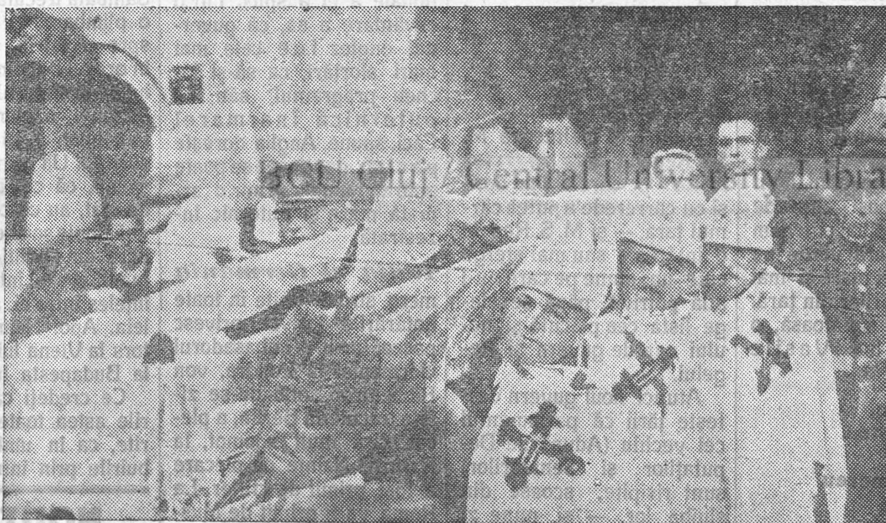
PE UMERI DE VITEJII...

sicriul care încheia în el corpul neinsuflit al Generalului Cantacuzino-Grănicerul ridicat pe umeri de credincioșii săi Comandanți legionari și dus din casa lui la carul mortuar care-l ducea la biserica Mihai Vodă. E calea cea din urmă ce o face, purtat pe sus, din casa sa dragă, spre casa lui Dumnezeu. Frumoasa „Domniță” cum îi zicea dânsul prea scumpei sale soții, moartă prea de timpuriu, — îl privea înfiorată din statua de marmoră din curtea sa... Că până azi îl vedea zilnic trecând viu pe lângă ea prin curte și-l vedea oprindu-se în fața ei și vorbindu-l... De azi ea, statuia, va rămâne orfană aci în curte și nimeni nu o va mai învălui în privirile sale iubitoare și înlăcrămate. De aceea e înfiorată statuia și par'că o lacrimă arzătoare îi isvorește din ochiul rece.