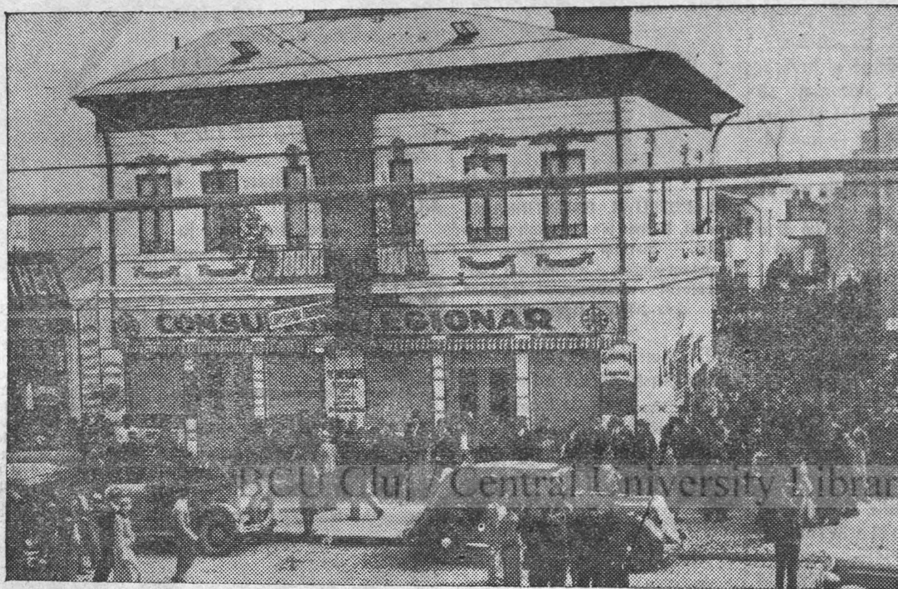
CASA COMERȚULUI LEGIONAR

cu prăvălie mare și restaurant, deschise în Octombrie a. c. la „OBOR”, în locul celor mai mari târguri de cereale (bucate) și de vite, dela o latură a Bucureștilor. — Se învârtă acolo lume nenumărat de multă, și aceea rătașea prea ușor în prăvăliile evreești și în restaurante de-ale lor, — pe cele ale modeștilor Români, cari mai au și ei în acea parte prăvălii și restaurante, neluându-le în samă așa ca pe cele evreești, — (că e evreul mai cu „lipici” pentru nepriceputul de Român...). — Acum greu să mai înconjoare prăvălia legionară și restaurantul legionar, în care gătesc și de ale gurei și marfa de trebuință, mai bună ca la jidani... — Cu bucurie aflăm că și prăvălia și restaurantul merg foarte bine! Birue prin IEFTINĂȚE, că nu lăcomesc la câștiguri mari bănești, se mulțumesc cu puțin, — ci se bucură de câștigul moral (sufletesc), pe care-l au din belșug. — Să nădăjdum că în curând CASA în care e așezată azi Cooperativa Legionară din chipul de mai sus, le va fi cu totul neincăpătoare și-o vom vedea lărgită la îndoit și împătrit!