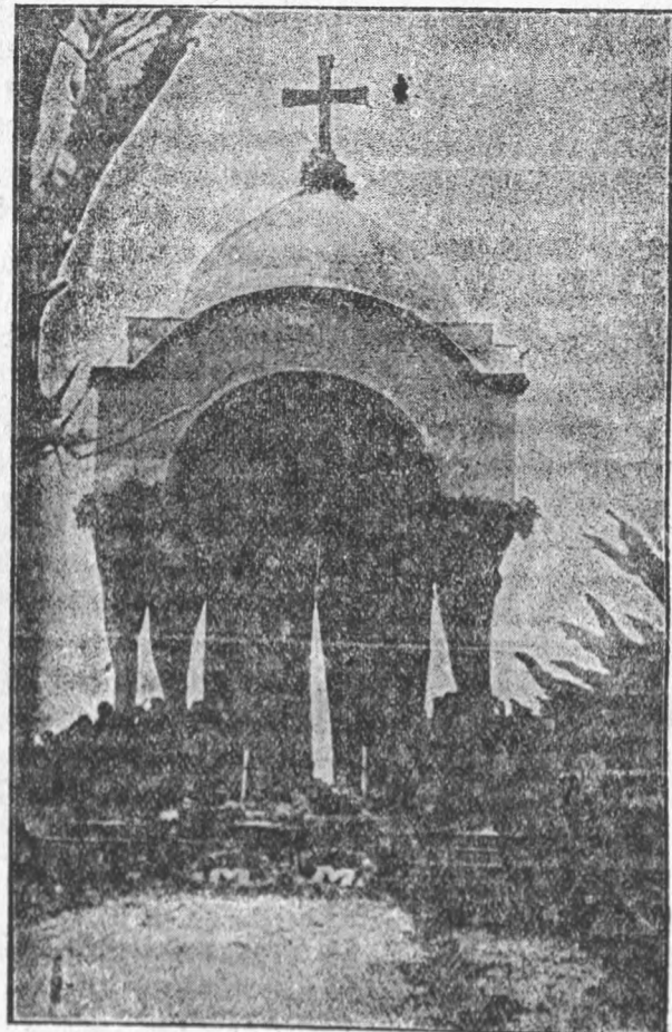
BALDACHINUL ÎNAINTE DE A FI ARS