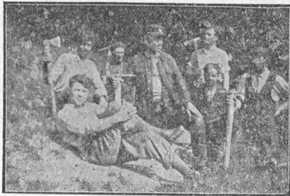
Harnicii cari si-au dăruit munca lor cu drag.

Vestea s'a lăsat și prin împrejurimi și țărani noștri au început să vadă și să înțeleagă, că nu mai este de așteptat dela felurii vânturătorii de vorbe, ci să facem la fel: