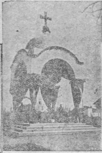
Mormântul Moța-Marin și mausoleul ce-l acopere, lângă Casa Verde