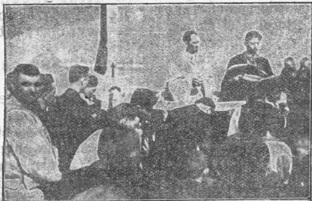
Preoții sfințesc fântâna legionară din Arpașul de jos.

Faceți și pe cunoscuții Dv. să se aboneze la »LIBERTATEA«