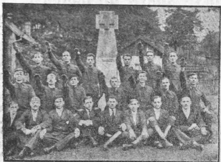
În chipul acesta vedem grupul de muncitori din LUPENI Hunedoara, lângă frumoasa Cruce zidită de ei astă-vară.