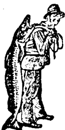
La cumpărarea Emulziei, luați sama să albă marca de scutur alui Scott: Pescarul!

G. Al. în Sop.-de-jos. De aici nu s'a oprit nici un număr. Numai s'a perdat undeva. S'a trimis de nou Nr. 7 reclamnt.